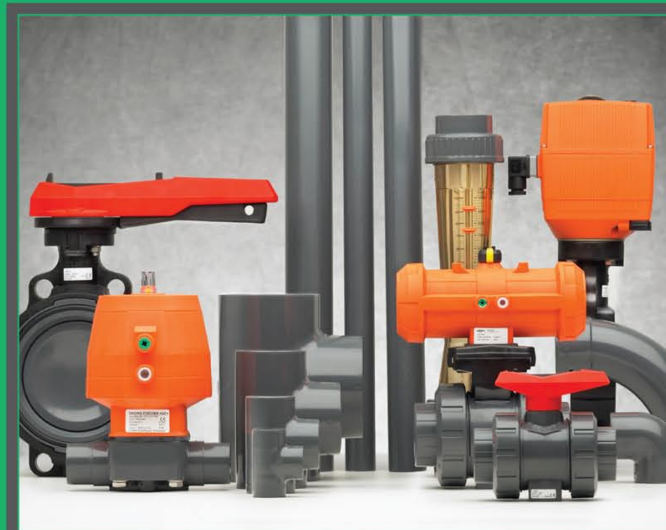
Tubos, Conexões e Válvulas em PVC e CPVC

“ Escolha termoplásticos com a garantia de entrega rápida da Complastec. ”