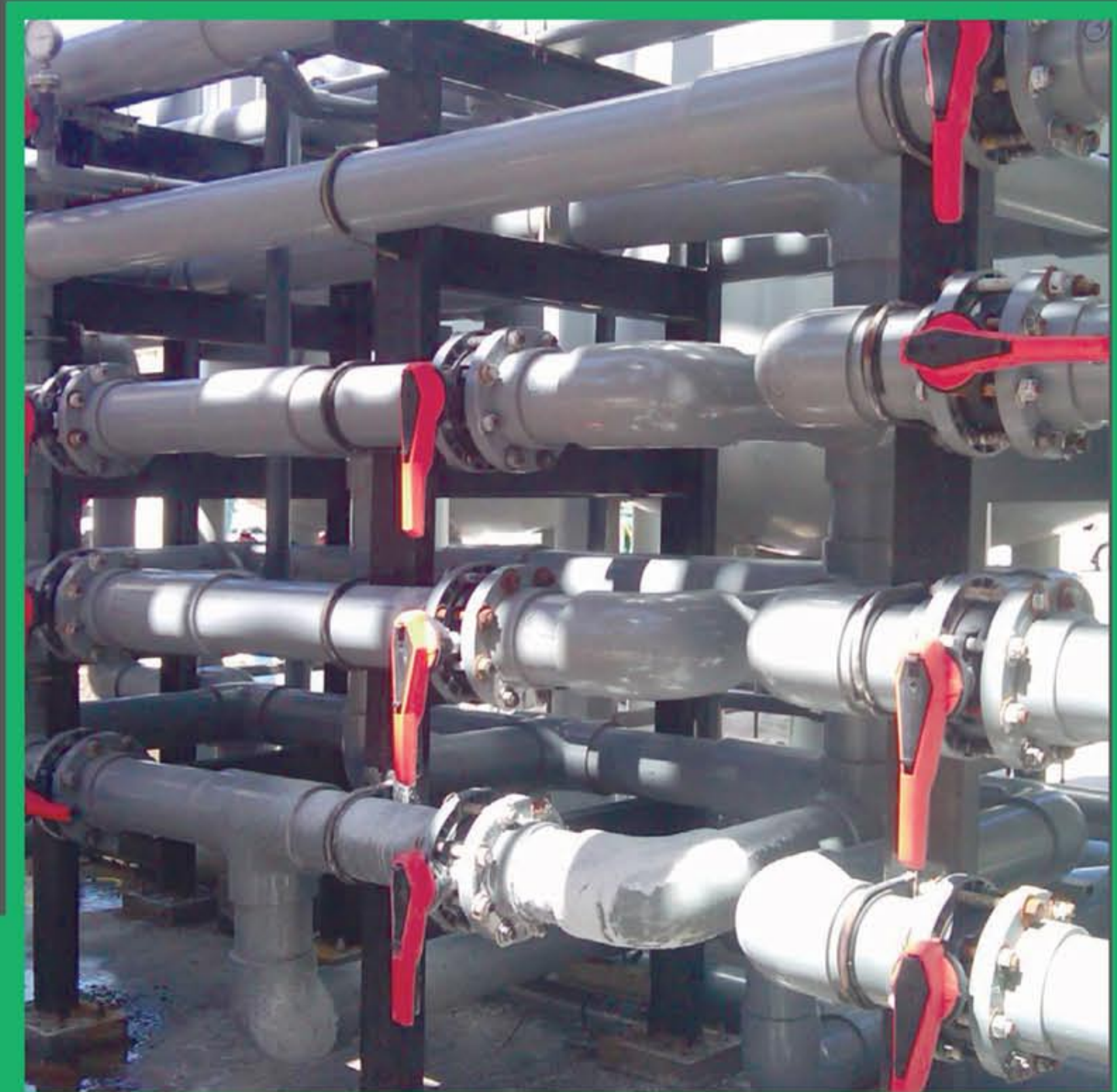
PVC e CPVC

“ Alta qualidade a fim de minimizar os riscos de vazamento ”