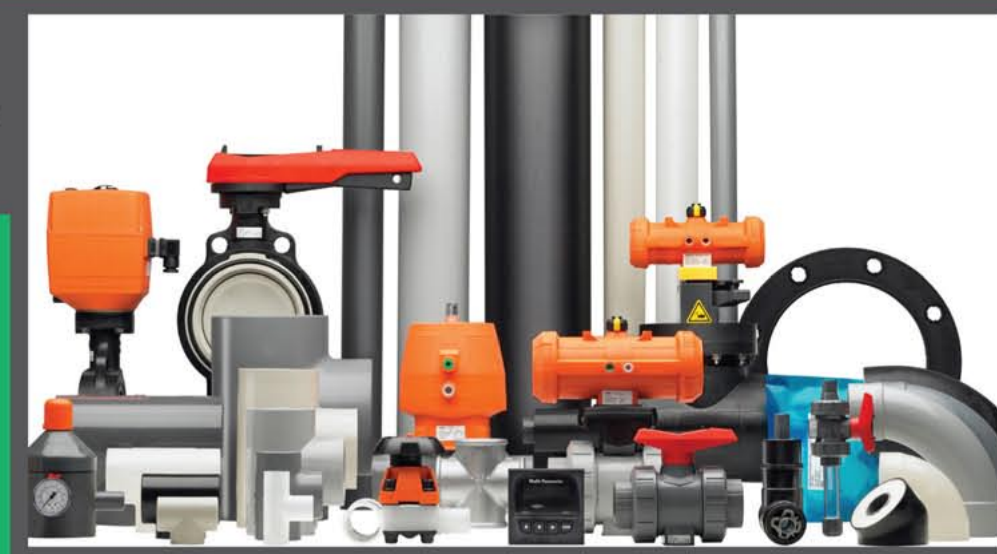
Soluções integradas em PVC, CPVC, PP e PEAD